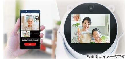
※画面はイメージです。