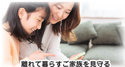
離れて暮らすご家族を見守る