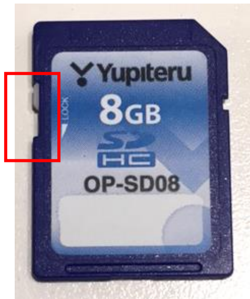
ライトプロテクトスイッチ OFF

SDカードを取り出して、ライトプロテクトスイッチをOFFにして、再度保存を試してください。