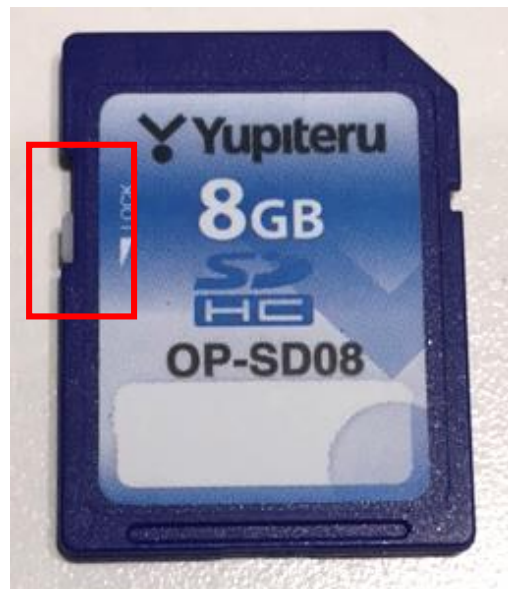
ライトプロテクトスイッチ ON